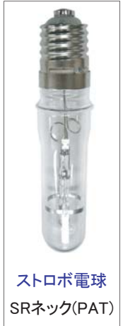
ストロボ電球 SRネック(PAT)

ケーブルコネクタにも防水加工を施すことで、水中灯ケーブルにキズが入りケーブル全体へ浸水が広がる状態(水走り現象)でも、灯具内部への浸水を防止可能。